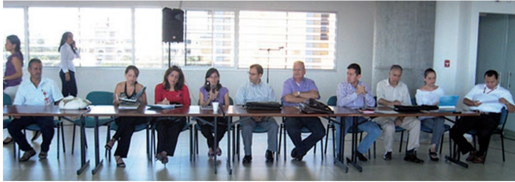
Mesa de trabajo del Comité Universidad - Empresa - Estado del Meta.

La región de la Orinoquia tiene un reconoci- miento internacional gracias a los recursos naturales existentes. El Departamento del Meta se ha convertido en primer productor nacional