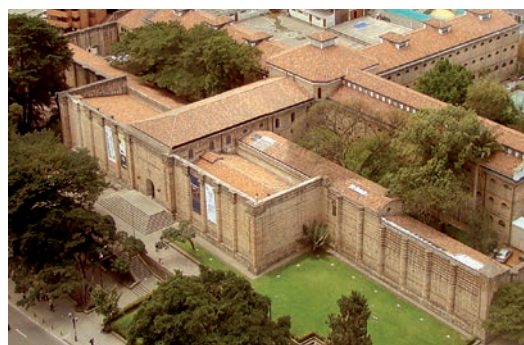
Museo Nacional de Colombia

de Arte Colonial, el Museo de trajes Regionales de Colombia, la Biblioteca Luis Ángel Arango, el Observatorio Astronómico Nacional, el Museo de la Independencia Casa del Florero, el Museo Nacional de Colombia y de la Casa Museo Quinta de Bolívar. La producción contó con la dirección de Carlos Ariel Jiménez, Director General de Proyección Social y con el apoyo técnico del realizador de cine y televisión Iván Prada Nagai y la comunicadora social Marcela Blanco, además del aporte de todo el equipo humano de la Dirección General de Proyección Social.