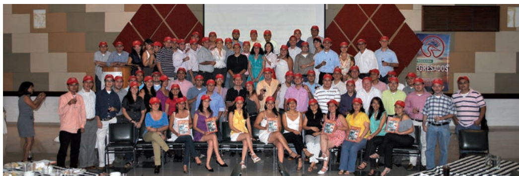
Encuentro de Egresados de la Facultad de Ciencias Básicas e Ingeniería.